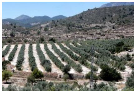
Aspecto de la plantación de olivos de la empresa Señoríos de Relleu. David Revenga